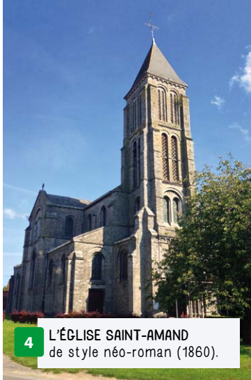
4 L'ÉGLISE SAINT-AMAND de style néo-roman (1860).