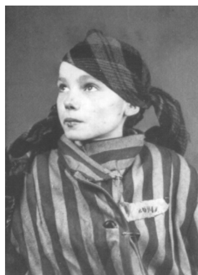
Katarzyna Kwoka, déportée le 13 décembre 1942, morte le 6 février 1943, vraisemblablement du typhus