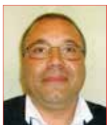
R. BENOIT Maire de Beaumont