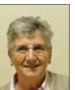
A.-M. CORSET Maire de Beugnon