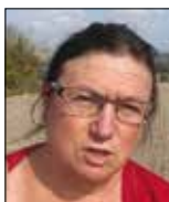
C. RATIVÉAU Maire d'Ormoy