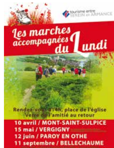
Animations de l'Office de Tourisme - été 2017

› Une volonté de faire du développement économique un axe fort de l'action communautaire, notamment par la mobilisation des espaces d'activités présents sur le territoire en prémices d'une démarche plus offensive de croissance en s'appuyant sur les forces vives du territoire.