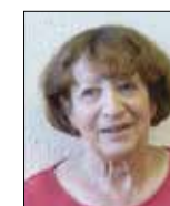
A. BASSET Brienon / Armançon