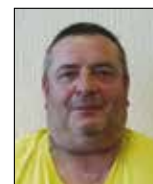
P. LÉCOLE Brienon / Armançon