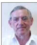
LE PRÉSIDENT Y. DELOT Maire de St-Florentin