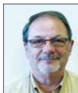
J.-L. QUERET Maire de Champlost