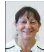
C. SEUVRE Saint-Florentin