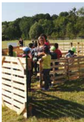
Les jeunes et l'environnement