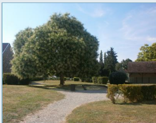
Lieu d'implantation de la future école

Trois architectes ont été sélectionnés après un appel public à concurrence. Ils déposent leurs esquisses à la fin du mois d'août. Ces esquisses seront exposées à Turny sous le porche de la Mairie dès le vendredi 4 septembre après-midi.