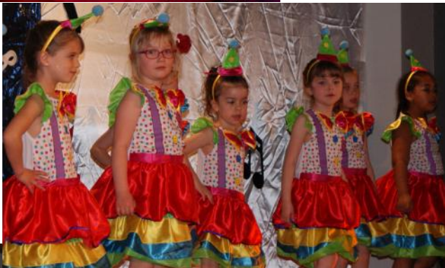
Les Justinettes Clown