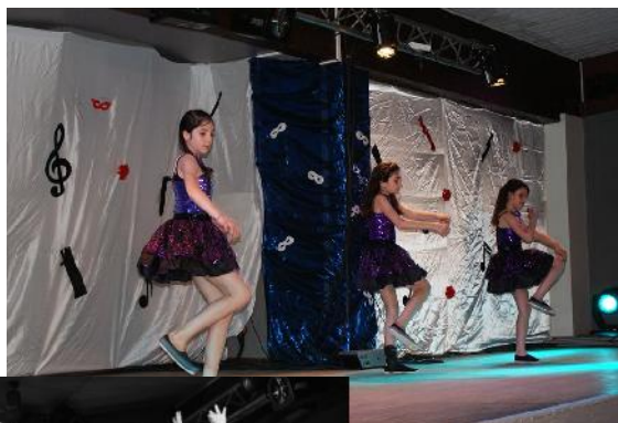
Les Lolitas Cheerleader