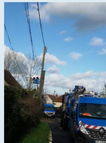
Intervention d'ERDF au Fays

La solidarité des habitants a permis à chacun de rester au chaud ou de sauver les congélateurs jusqu'au rétablissement de chaque foyer. C'est seulement le 24 février que le téléphone, et donc internet ont pu être remis en fonctionnement. Par contre l'éclairage public n'a pu être réparé car trop ancien. Le SDEY qui gère notre réseau propose le remplacement des six luminaires par des éclairages LED sans changer les poteaux, proposition acceptée par le conseil municipal début mai permettant ainsi une modernisation de l'ensemble de l'éclairage publique de la rue des Puits au Fays.