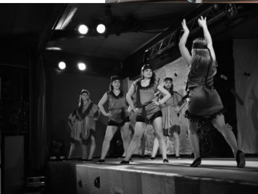
Les Laetistars et Les Diablesses Mama