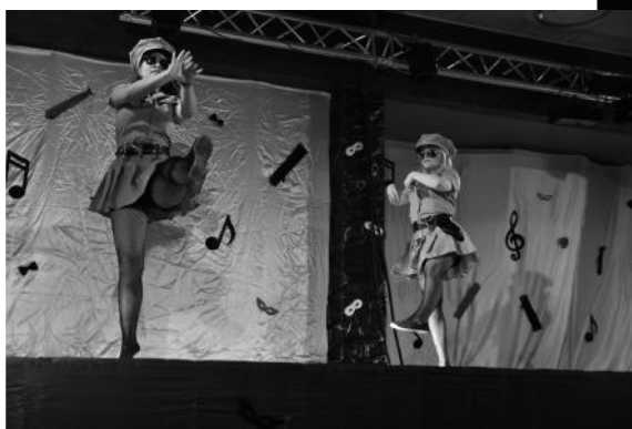
Les Diablesses - Policeman