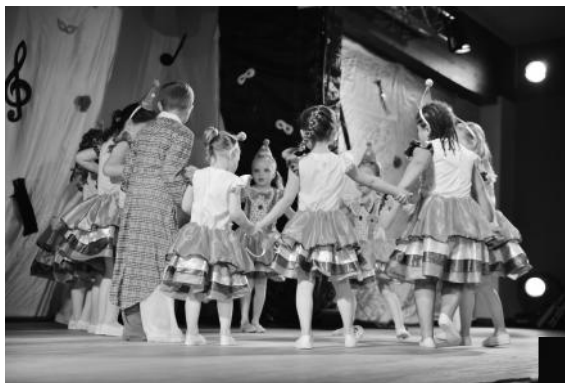
Les Justinettes - Clown