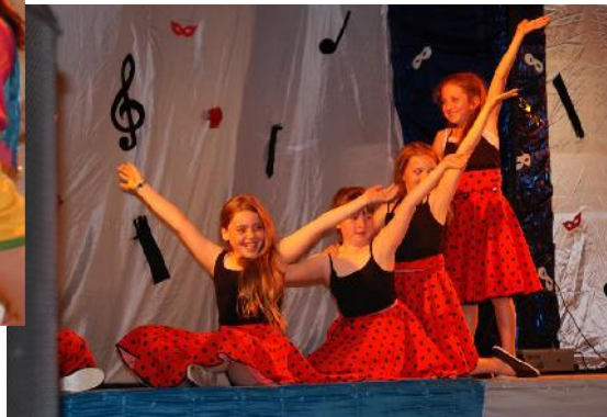
Les Ptites feuilles - Limbo

Après plusieurs sorties effectuées tout au long de l'année, ce gala annuel tant attendu est arrivé ce samedi 28 mai dernier.