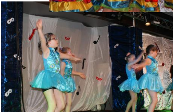
Les Ptites feuilles Le sens de la vie