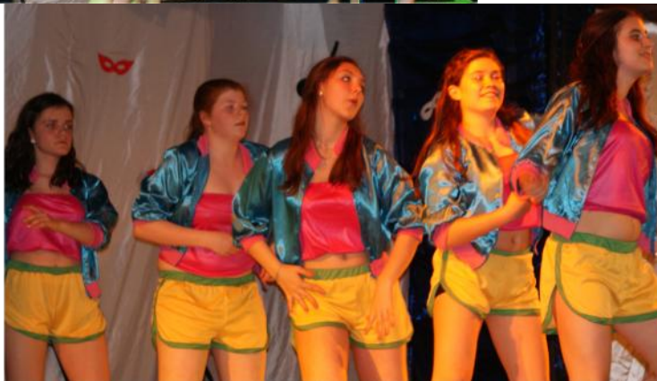
Les Laetistars - Remix