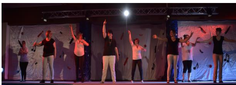
La danse des mamans