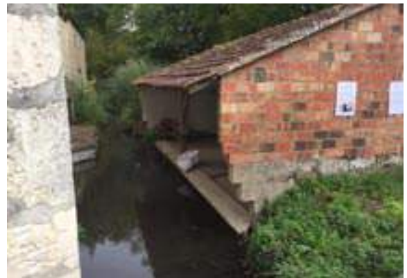
Le lavoir ru de l'Abreuvoir à Linant