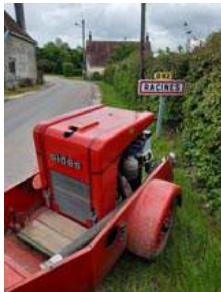
Motopompe du CPI

Pour rester dans la nouveauté, l'Amicale des sapeurs-pompiers de Turny a racheté au mois de mars, une motopompe, permettant un meilleur débit d'eau sur les incendies. Cet achat fait suite à la fermeture du Centre de Première Intervention (CPI) de Racines (10), qui, suite à un manque d'effectif et de recrutement, a été contraint d'arrêter ses activités. Cette motopompe présente, sous forme de remorque, une ressource nécessaire et efficace sur incendie. Ressource d'autant plus importante que notre commune présente de