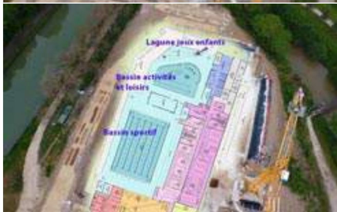
Travaux du Centre nautique à Saint Florentin par la CCSA

SARL RG Electr'eau Plomberie Electricité