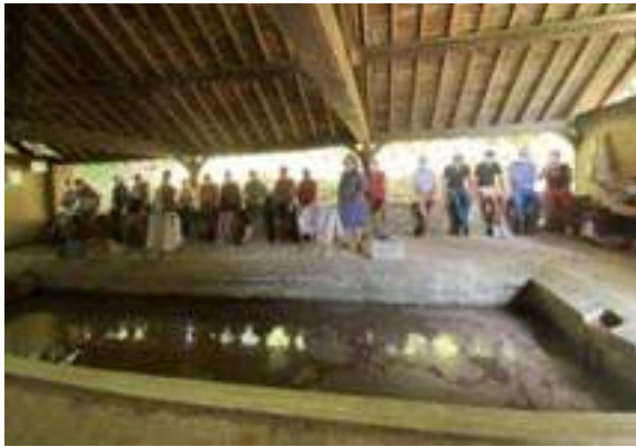
Le lavoir des Gueules de loups à Linant

En janvier, nous espérons des jours meilleurs... Ils semblent arriver ! Nous devons donc reprendre les activités nécessaires à la poursuite de notre but : "participer à la sauvegarde du patrimoine communal."