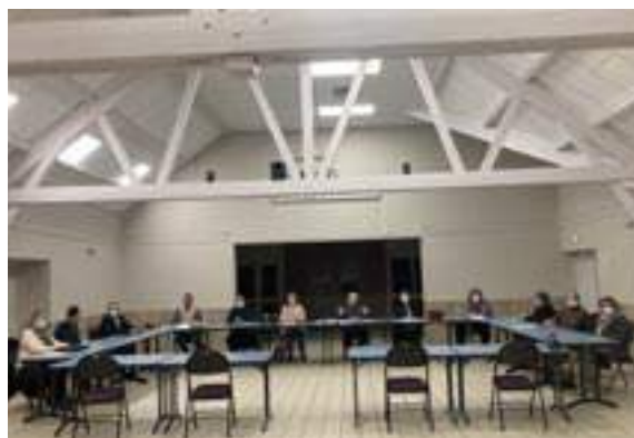
Les réunions du conseil municipal se sont déroulées dans la salle des fêtes afin de respecter les gestes barrières