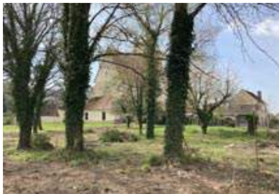
Aménagement du terrain derrière l'église

La rue du Magoula verra son revêtement repris dans le cadre des travaux menés par la communauté de communes. Les habitants sont prévenus de ces travaux afin de ne pas y stationner leurs voitures.