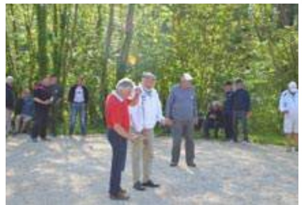
Turny Pétanque sur les terrains Chemin de Ronde