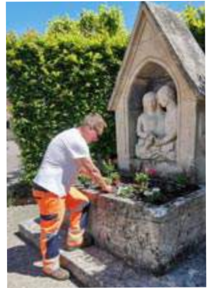
Fleurissement par la commune

Cette année, des jardinières et suspensions embellissent les lavoirs de la Croix Saint Pierre à Turny, de la rue de l'Abreuvoir à Linant, du lavoir du Fays ainsi que des puits de Linant et du Saudurant. Quand à la fontaine, des plantes aromatiques sont venues rejoindre les annuelles. Les plantes aromatiques seront à votre disposition avec parcimonie bien évidemment dès cet été.