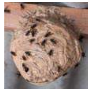
Nid de frelons

L'été approche et comme à mon habitude, je tiens à réaliser de la prévention sur les risques saisonniers. L'été dernier fût marqué par une importante quantité de nid de guêpes et de frelons, que nous sommes encore, sur notre commune, habilités à détruire gratuitement. Dans le cas où vous auriez un nid chez vous, n'hésitez pas à appeler la mairie afin que nous mettions en place les mesures nécessaires à sa destruction, si cela reste matériellement possible pour nous. Afin de vous aider à mieux reconnaître ces nids, ainsi que leurs habitants, je vous laisse en illustration de quoi les identifier.