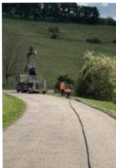
Passage de la fibre entre Le Fays et Le Saudurant

Les travaux avancent... Vous avez vu les tranchées le long des routes, là où n'y avait pas déjà des fourreaux qui puissent permettre le passage de la fibre. Des chambres dans lesquels des raccordements sont réalisables ont été ajoutées. Puis, c'était le tour des ouvriers qui tiraient le câble, d'une chambre à l'autre et dans les agglomérations, faisaient monter cette fibre sur les poteaux électriques ou téléphoniques. Sur ces poteaux, des boîtiers sont installés. C'est de ces boîtiers que la fibre partIRA pour alimenter les maisons.