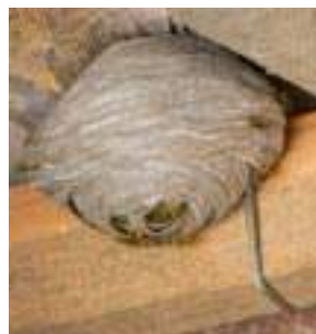
Nid de guêpes

cette maladie. Cette dernière ne touchant plus seulement les personnes les plus vulnérables, il reste recommandé de garder, encore quelques temps, vos précautions.