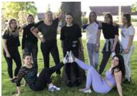
Groupes de Justine

En continuité de l'année 2020, c'est avec tristesse que cette année encore la troupe ne pourra pas vous présenter son gala annuel au vu de la situation sanitaire.