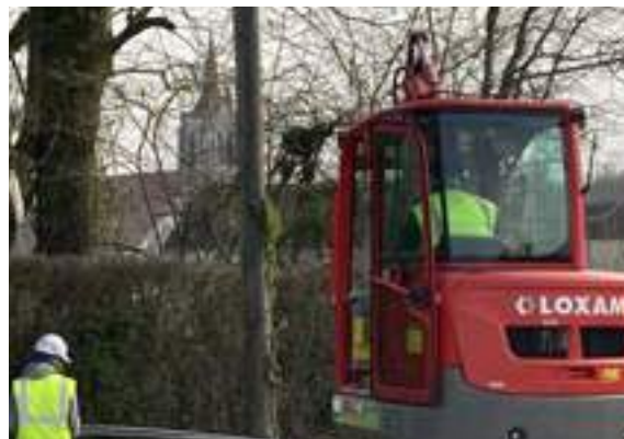
Passage de la fibre à Turny

Il faudra donc prochainement amener un câble de ces boîtiers vers votre domicile. Ce sera le travail de l'opérateur que vous aurez choisi, puisque les 4 opérateurs Orange, SFR, Free et Bouygues auront la possibilité de vous démarcher, 3 mois après la fin des travaux dans la commune. Chez vous, le câble doit pouvoir emprunter le même chemin que votre câble téléphonique actuel. Il ne peut être agrafé, il sera collé. A son extrémité ce ne sera pas une prise, mais un boîtier. Son emplacement sera définitif ! C'est sur ce boîtier que la box Internet sera branchée. La box transformera le signal optique en Wifi et en signal Internet alimentant les prises RJ45 classiques. C'est de cette box aussi que partira le téléphone. Ce qui veut dire que les personnes n'ayant actuellement pas de box, mais seulement le téléphone, devront avoir une box où l'internet sera désactivé car les réseaux téléphoniques cuivre vont disparaître... pas tout de suite, mais à moyenne échéance.