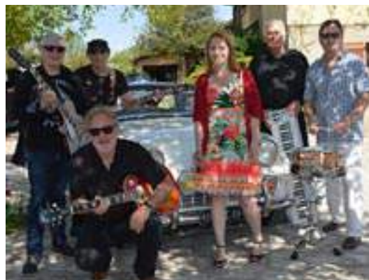
Le groupe pop-rock Vice Versa