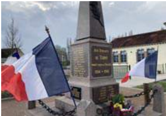
8 mai 2021 au monument aux morts de Turny