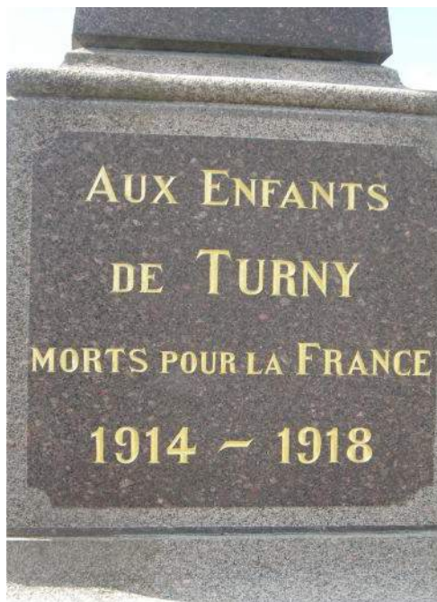
Monument aux Morts de Turny