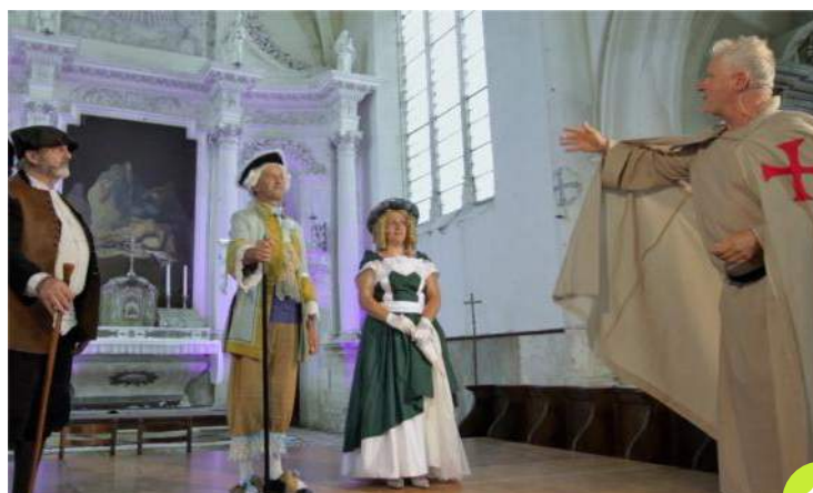
Le Seigneur de Barbezières et Madame