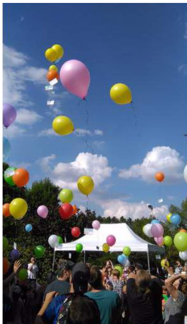
Lâcher de ballons du 14 juillet 2018

Traditionnellement à Turny le défilé aux lampions est organisé la veille du 14 juillet. Les enfants tous fiers d'arborer leurs bracelets fluorescents et accompagnés de leurs parents, familles et amis déambulent dans le cœur du village à la nuit tombée en un joyeux cortège coloré et lumineux pour rejoindre l'espace sportif des Maraux. Et c'est là qu'éclate le feu d'artifice suivi du verre de l'amitié. Cette année encore de nombreux habitants des villages voisins sont venus se joindre aux turrois pour ce feu d'artifice de la fête nationale.