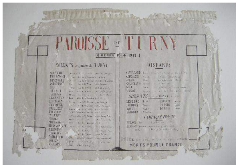
Tableau dans l'église de Turny