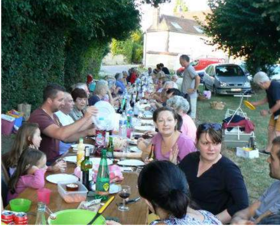
Fête des voisins à Linant le 11 août 2018