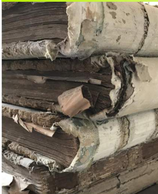
Matrices cadastrales de Turny

La Loi prévoit dans le Code du patrimoine que les communes de moins de 2 000 habitants doivent déposer leurs archives de plus de 100 ans aux Archives départementales. La commune reste propriétaire de ces archives mais la responsabilité en incombe aux Archives départementales. Elles ont la charge de leur bonne conservation et de l'accès de ces documents au public.