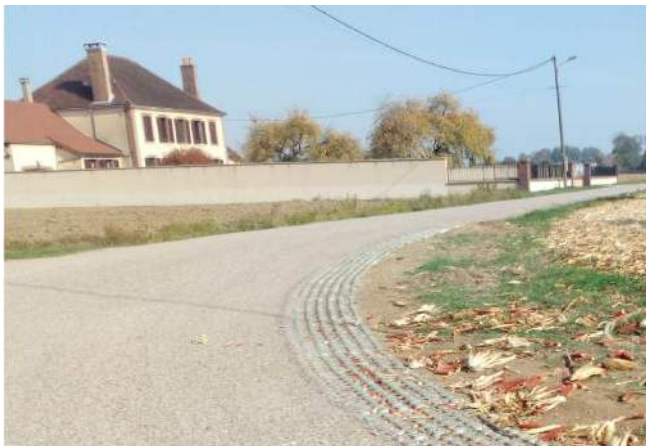
Over-green dans le virage de l'Allée du château à Bas-Turny

Cette année nous avons rénové le chemin du Grisar en prenant soin de traiter l'eau pluviale, facteur important des dégradations. Nous avons donc avec la CCSA refait cette entrée de chemin par une solution en partie enrobé et en partie enduite.