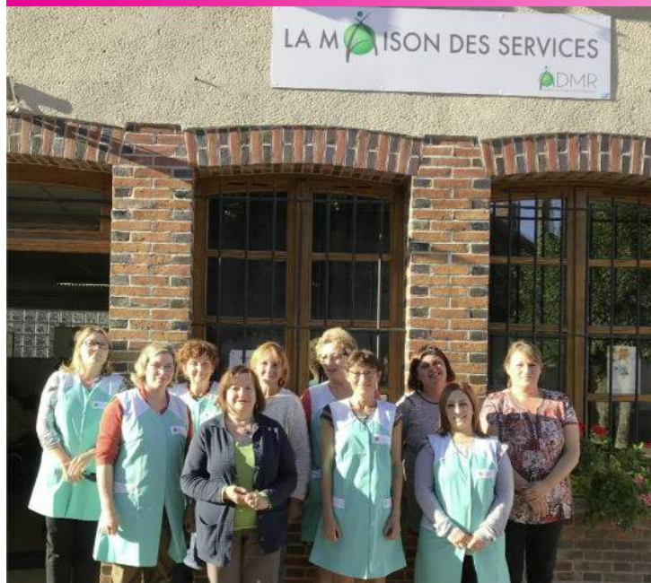
L'équipe des aides à domicile de l'ADMR Chailley

ADMR Chailley, Maison des Services 1 rue Abel Boichut 89770 Chailley 03 86 35 30