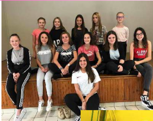
Groupe des ados animé par Automne