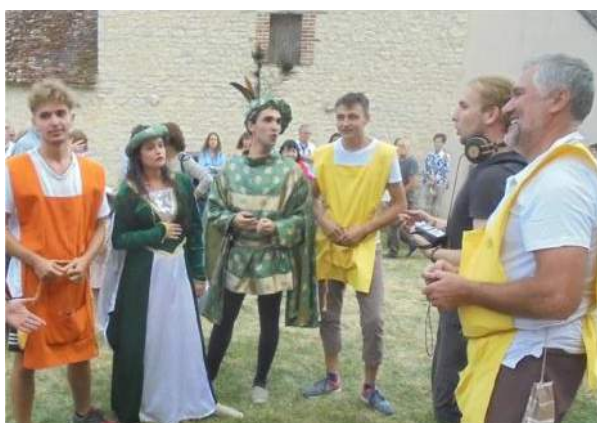
Le Seigneur de Lespinasse