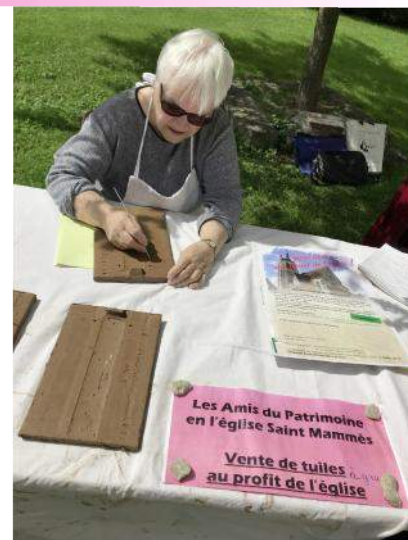
Gravure de tuiles par l'Association du Patrimoine au profit des travaux de rénovation de l'église Saint Mammès