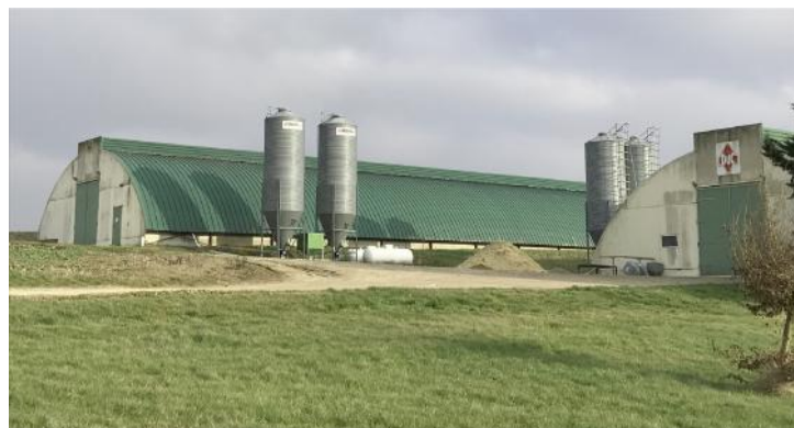
Poulaillers au Fays