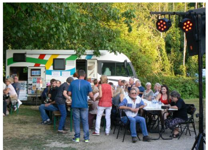
L'Office du Tourisme Serein et Armançe présent avec son bureau mobile de tourisme