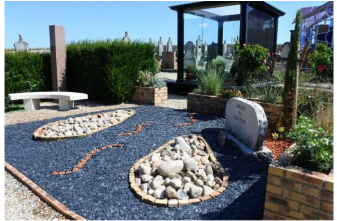
Le jardin du souvenir : APRES

L'occasion est donnée de rappeler que si les ornements, attributs funéraires, voire plantations sont possibles sur les cavurnes, l'espace attribué à ces concessions est limité à leurs surfaces (70 x 40 cm). Il convient donc de veiller à ne pas le dépasser pour éviter une intervention forcément désagréable des services municipaux.