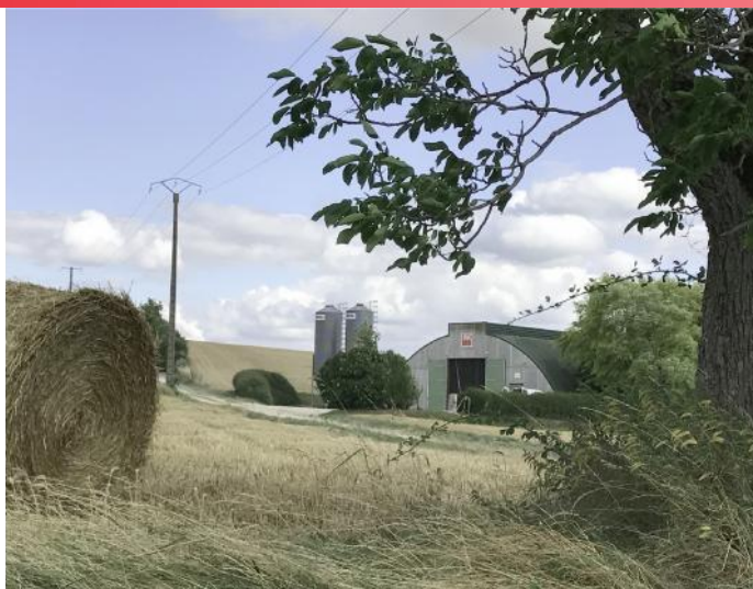
Poulailler au Saudurant

Plukon est un des principaux acteurs sur le marché européen de la volaille, avec 11 abattoirs de volaille et 8 sites de transformation et de conditionnement aux Pays-Bas, en Allemagne, en Belgique, en France et en Pologne. Son siège français est situé à Chailley. Duc avec 450 emplois est le premier employeur de la communauté de communes. Avec un investissement de 12 millions d'euros, la production est passée à 700 000 poulets par semaine.