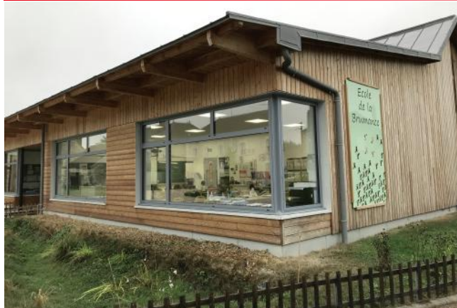
Classe CE1-CE2 à l'Ecole de la Brumance

C'est avec joie et un peu d'angoisse que les enfants ont repris l'école ce lundi 2 septembre 2019.