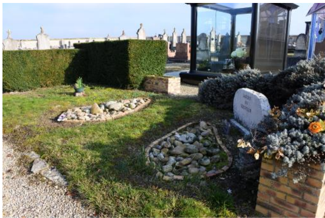
Le jardin du souvenir : AVANT

La commune vient de se mettre en conformité avec les textes lors du réaménagement de son jardin du souvenir.