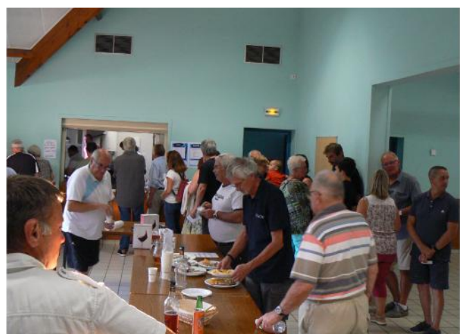
Pôle restauration Bistrots Nomades organisé par Turny Pétanque