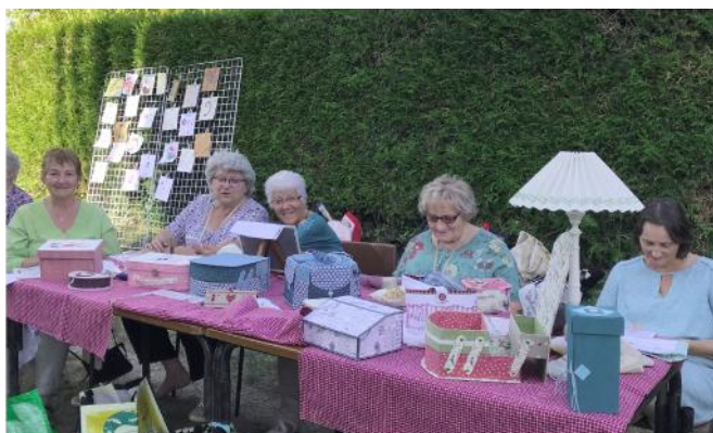
A Tous Points aux Journées du Patrimoine à Turny

Pour tout renseignement et pour obtenir le calendrier des séances de l'année 2019/2020, vous pouvez contacter la mairie qui fera suivre à la présidente.