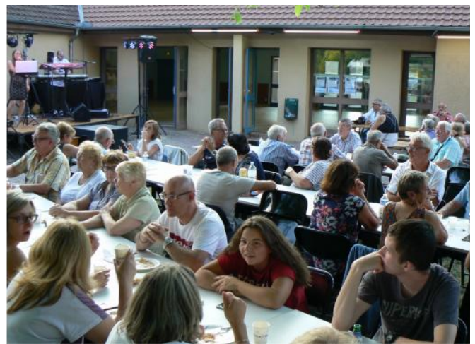
Un public nombreux venu apprécier le groupe ABSOLU années 80