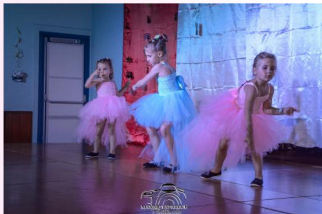
Les petites sur Les Troll's