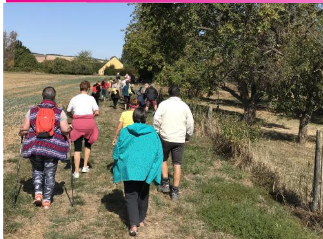
Marche douce Association Sportive de Turny

L'Association Sportive de Turny innove pour la saison 2019-2020 en proposant une marche douce suivie d'un goûter chaque 3 e jeudi du mois.