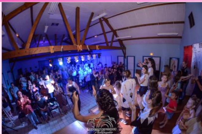
Honneur au public très chaleureux lors du gala à Turny