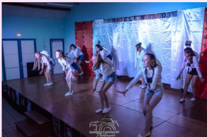
Les Ados sur Footloose