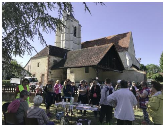
Goûter fin de randonnée le 19 septembre 2019

Le bureau de l'Association Sportive de Turny