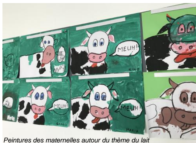
Peintures des maternelles autour du thème du lait