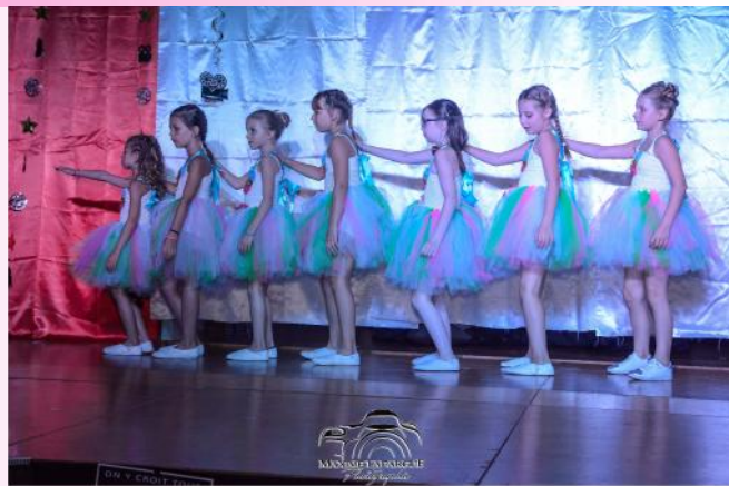
Les grandes sur remix Scoubidou