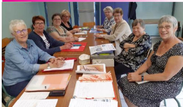
Assemblée générale A tous Points

L'association A Tous Points a tenu son Assemblée Générale le samedi 28 septembre 2019 en présence de ses membres.