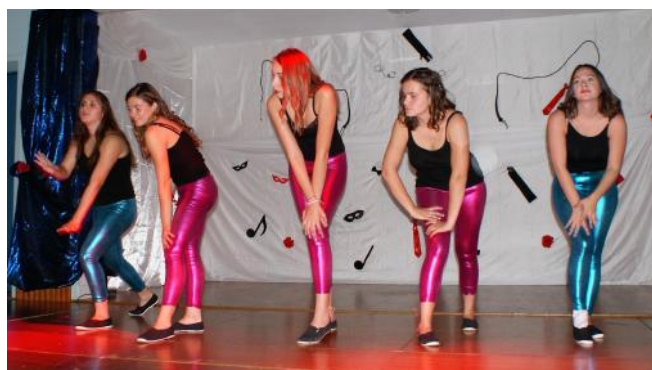
Les Laetistars dans What do you mean (Spectacle à Turny)