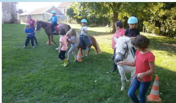
Activités Poney et Danse pour les NAP rentrée 2016

Le lundi, l'activité danse animée par Véronique Attal se prolongera aussi jusqu'à Noël ce qui permettra aux participants de présenter le fruit de leurs répétitions en première partie de la fête de Noël qui aura lieu au mois de décembre.