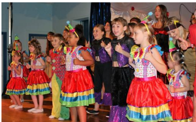
Pause détente avec le public chaleureux de Turny

Après avoir fait une représentation début septembre à Saint-Florentin, n'ayant pas pu participer à la Fête patronale à Turny au mois de mai à cause du mauvais temps, une partie de la troupe a représenté le gala à Turny le 1 er octobre.