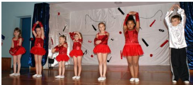
Le et Les Justinettes dans Albatroz (Spectacle à Turny)

La rentrée de TURNY DANSE s'est faite avec un effectif de 39 danseuses et 1 danseur.