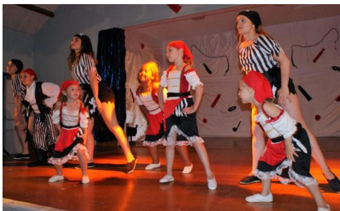
Entrée Pirates des caraïbes Spectacle à Turny