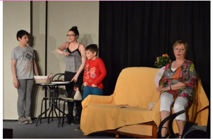
Ingratitude à tout âge La compagnie du parapluie à Turny