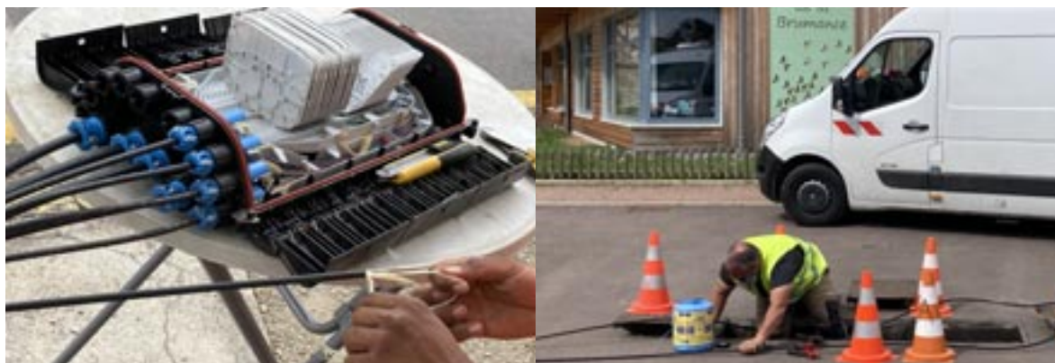
Raccordement de la fibre à Turny

Une demande de subvention a été faite pour une participation à hauteur de 40 %