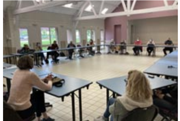
Réunion de hameau des habitants du Fays