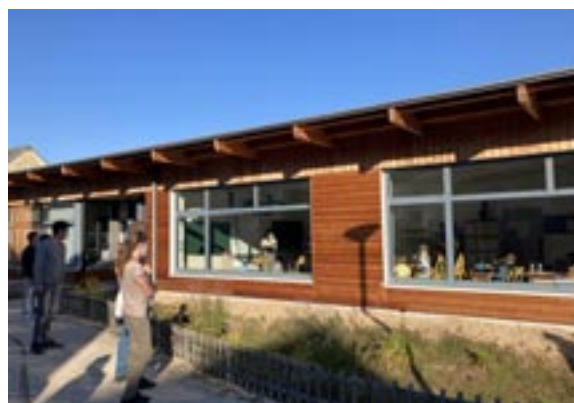
Jour de rentrée à l'Ecole de la Brumance

La rentrée scolaire à l'école de la Brumance de Turny s'est bien déroulée. Le sourire des enfants montrait qu'ils étaient heureux de se retrouver et commencer l'année avec leurs maîtresses respectives : Alexandra Lebeau pour les CE1-CE2, et Céline Jeandarme pour la classe de maternelle. Les effectifs sont de 21 élèves en classe élémentaires (14 CE1 et 7 CE2), et 18 en classe maternelle (5 en petite section, 7 en moyenne section et 6 en grande section). Les enseignantes et les élèves de l'école élémentaire étaient encore contraints de porter un masque, mais cette contrainte sanitaire a été supprimée début octobre pour les enfants.