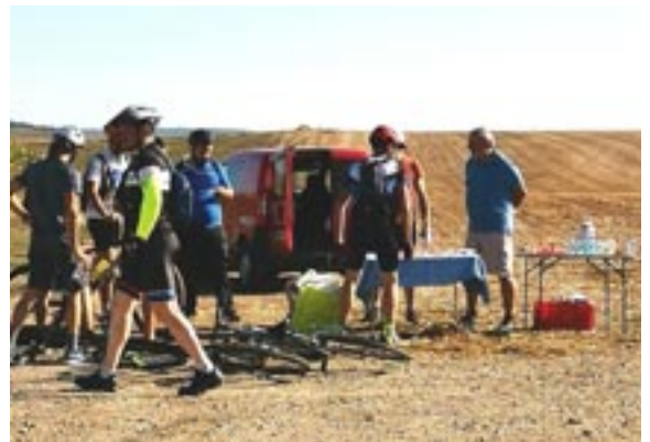
Stand ravitaillement pour la randonnée annuelle

C'est avec plaisir que nous avons pu à nouveau organiser une randonnée ouverte à tous le dimanche 12 septembre. La formule était nouvelle car nous nous sommes associées à la commune pour proposer 2 parcours VTT en plus des 2 parcours pédestres. Cette nouveauté a séduit puisqu'une centaine de participants (dont 1/3 de VTTistes et 2/3 de marcheurs) se sont lancés sur les chemins !