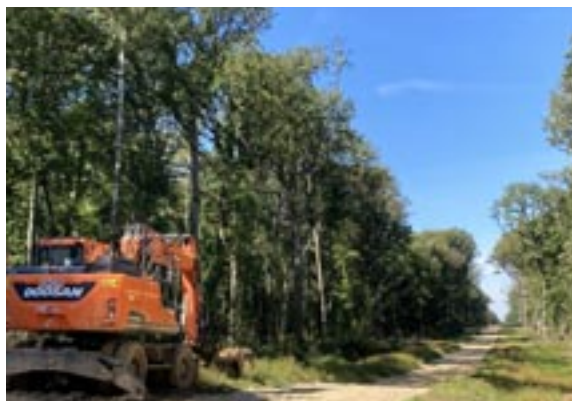
Route forestière Turny Chailley

La météo peu favorable a prolongé la suspension du chantier avant que l'entreprise prenne ses congés en août ... ! Le chantier a repris le 8 septembre. L'utilité de cette route est défendue par l'ONF. Son coût devrait être couvert par une subvention européenne et la vente des bois coupés pour sa réalisation.