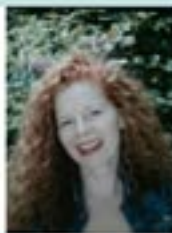
Habitante de Turny

www.michele-sophro.fr - 06 17 46 80 96 12 place Emile Drominy - 89210 Briennon sur Armançon