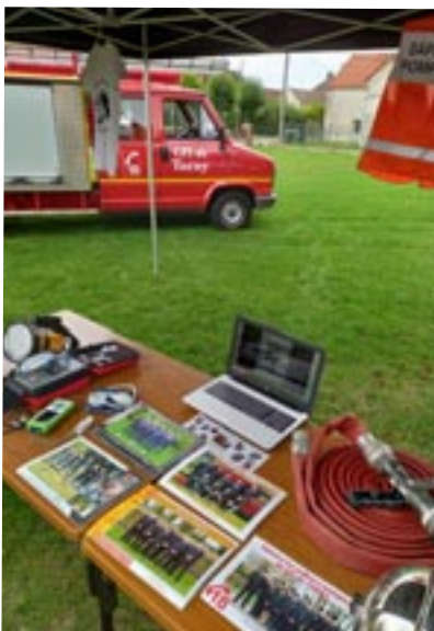
Stand de l'Amicale des pompiers du CPI de Turny au Forum des associations