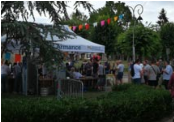
Buvette et crêpes

Des retours positifs nous affluent de la part des artistes et des visiteurs.