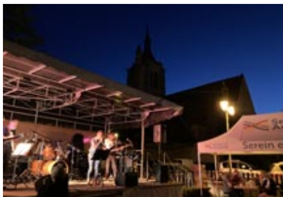
Le groupe pop rock Vice Versa

Cet été, vous avez été nombreux à participer à la soirée des bistrots nomades de Turny qui s'est tenue le 30 juillet 2021. Cet évènement a été organisé par l'Office du tourisme de la communauté de communes Serein Armance, en partenariat avec deux associations de Turny, l'Amicale des Sapeurs Pompiers et l'association Turny Cats.