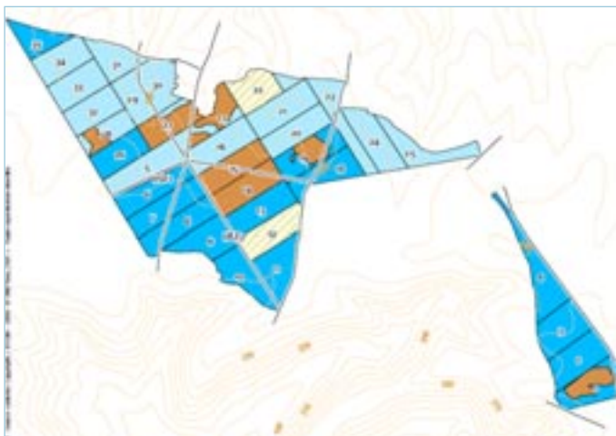
Les peuplements de la forêt de Turny