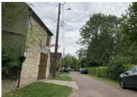
Chaussée refaite à Courchamp