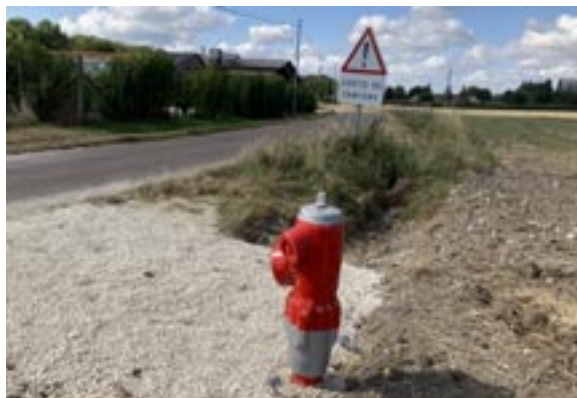
Borne à incendie aux Maraux