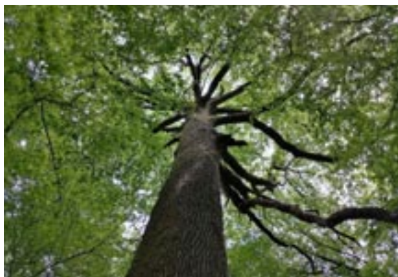
Chêne remarquable de la forêt de Turny