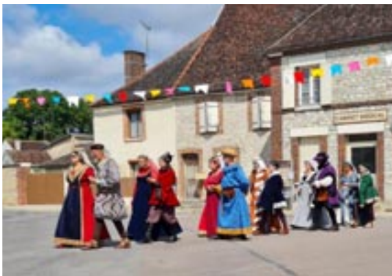
Les Danseries d'Aballone d'Abalone

Installation des scènes, barnums, de l'électricité, des tables, des chaises, des barrières de sécurité, des guirlandes colorées, tenue de la buvette, préparation de la restauration, accueil des visiteurs et des artistes... Nos bénévoles ont travaillé très dur pour permettre au Festival de démarrer dès 14h.