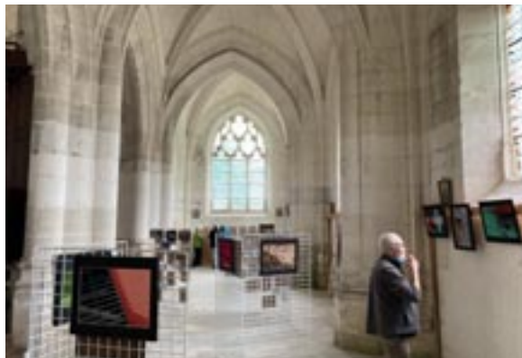
Exposition photos à l'église Saint Mammès pour les Journées du Patrimoine