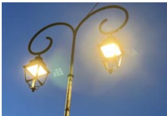
Eclairage leds à Turny