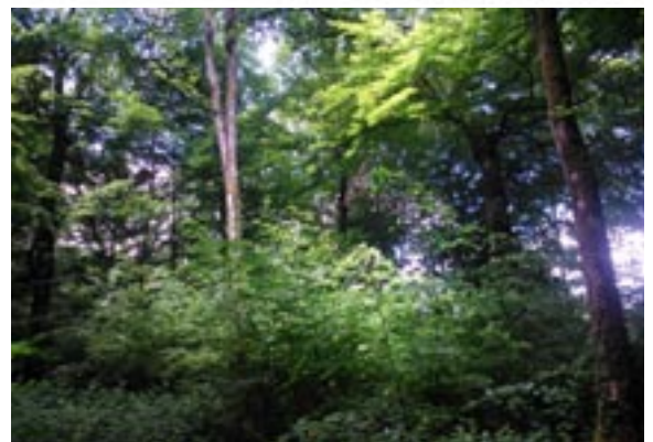
La futaie irrégulière