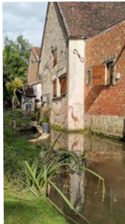
Moulin à tan à Bas-Turny

C'était une occasion unique de visiter les moulins de la Brumance à Turny les samedi 18 ou dimanche 19 septembre ! Les Journées du Patrimoine 2021 ouvraient la possibilité à Turny Animation d'organiser une randonnée d'environ 6.5 kms en lien avec l'Association Sportive de Turny et incluant 3 visites de moulins actuellement propriétés privées.