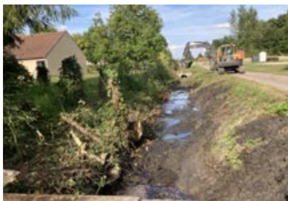
Curage du fossé du Chemin de Ronde