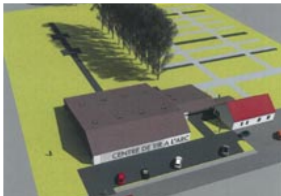
Centre de tir à l'arc à Briennon

Après la réalisation et la mise en service des équipements intercommunaux situés hors de Saint-Florentin, ville centre de la Communauté de communes (le paddle au centre tennistique de Vergigny et l'école de musique à Venizy), c'est le centre nautique situé au port de Saint-Florentin qui s'élève au fil des mois, le centre de tir à l'arc qui doit être prêt pour les prochains jeux olympiques et la maison de santé de Saint Florentin qu'il faut concevoir avec les équipes médicales. Ce sont donc des projets importants que la communauté de communes continue de mettre en œuvre à la fois pour valoriser l'image de la CCSA et pour répondre aux besoins de la population.