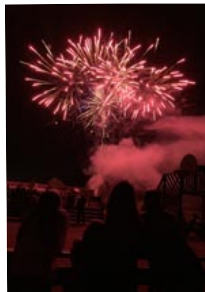
Le feu d'artifice de la commune a été tiré à la suite du Bistrot Nomade, la météo du 14 juillet n'ayant pas permis de le faire.