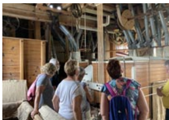
Moulin Chevillard aux Maraux

C'est un moulin qui a fait du chanvre et de la farine. A l'origine le moulin appartenait à Mme de la Rochefoucault. Puis ce sont 6 générations de Paillery qui se sont succédées au moulin neuf dont l'activité a définitivement cessée en 1977. Les visiteurs ont pu voir l'arrivée d'eau, le lieu de déchargement des grains (blé, orge etc.) et quelques éléments des mécanismes. L'ensemble n'est pas en très bon état mais le jeune couple ayant racheté la propriété à Nicolas Bonnet a de nombreux projets pour faire revivre le moulin.