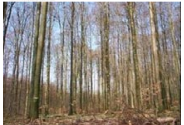
La futaie régulière

Avantages : assure un revenu régulier, autorise une souplesse de gestion des coupes et une adaptation au marché, convient bien aux petites forêts et aux milieux fragiles ou hétérogènes, permet la culture d'essences variées dont certaines ne poussent qu'à l'état disséminé, évite la coupe rase et de gros investissements en plantation, résiste aux vents et aux attaques parasitaires.