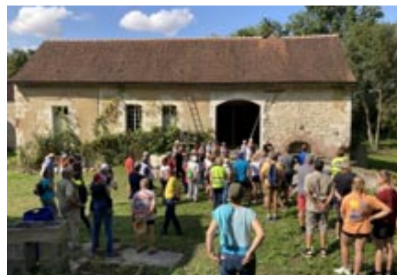
Moulin Paillery à Turny

La visite de la minoterie du moulin Chevillard a été très appréciée, et a provoqué de belles émotions à ceux qui avaient connu M. Chevillard ou travaillé avec lui : l'ancien boulanger de Sormery, les agriculteurs qui fournissaient le grain... Si la meule n'est plus en place, tous les mécanismes de transformation de la mouture en farine sont encore visibles et en bon état : les ascenseurs à godets, l'humidificateur, les brosses à grains, les broyeurs, le tamiseur.