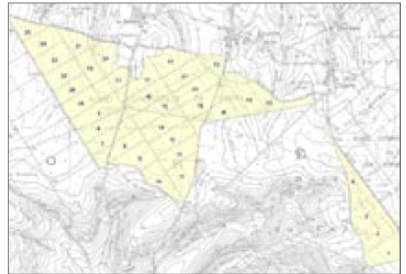
Plan de la forêt communale de Turny